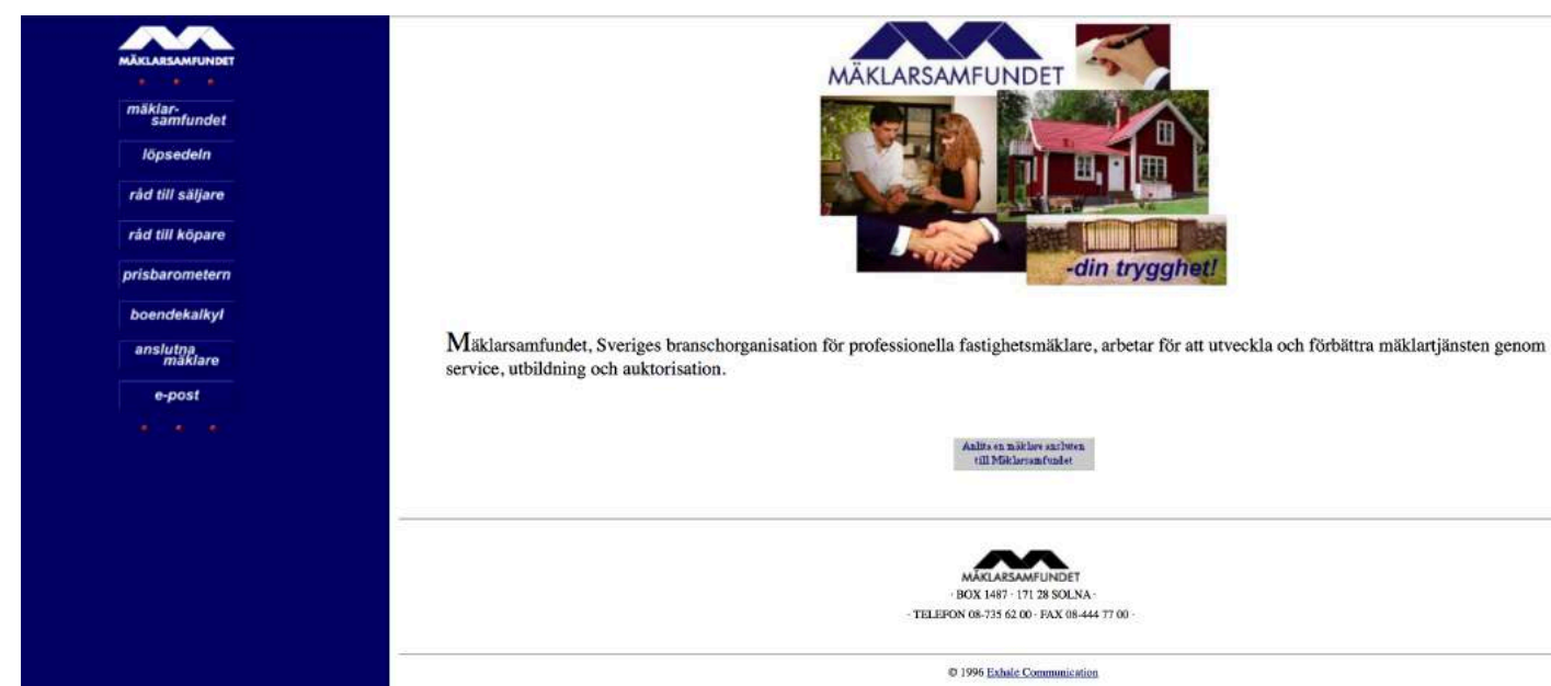
Mäklarsamfundet blir med webbsida 1997 och rekommenderar alla medlemmar att själva skaffa sin egen. Domänen registrerades redan året innan.