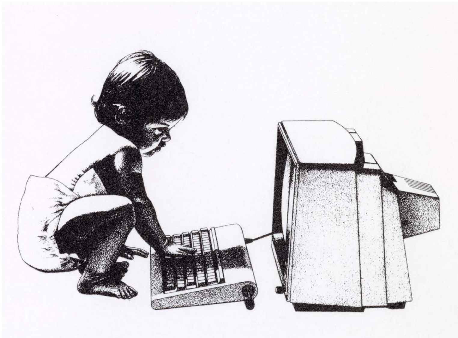
Hur skulle världen bli med datorer? Få anade nog värdet hos persondatorn när den lanserades i början av 1980-talet.