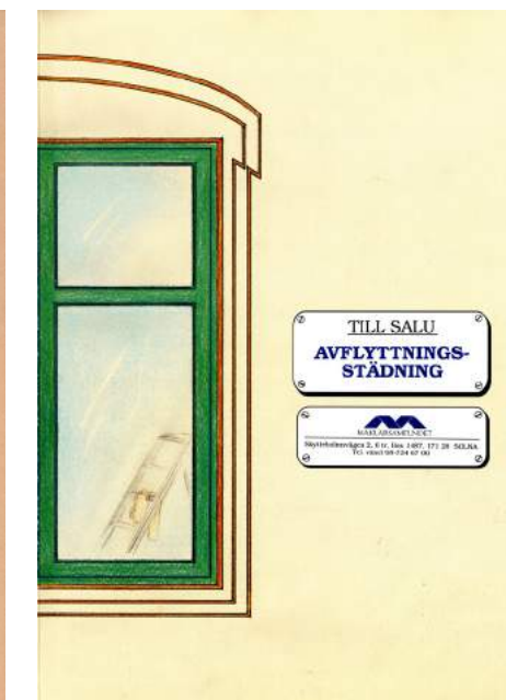
Foldrar från Mäklarsamfundet pre Internet. Information om försäljning till både bransch och kunder har i mångt och mycket digitaliserats.